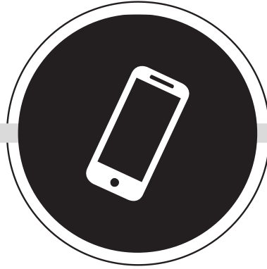
TELEFON VE TABLET