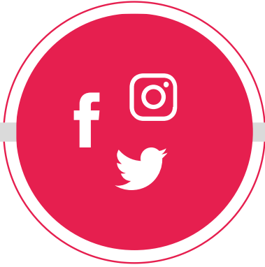
İNTERNET VE SOSYAL MEDYA