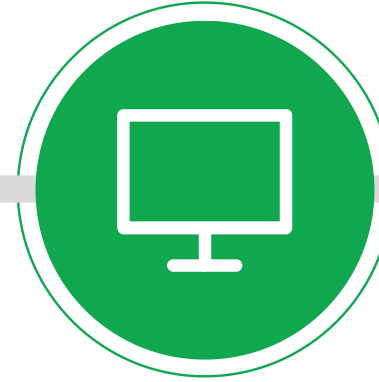
BİLGİSAYAR VE TELEVİZYON